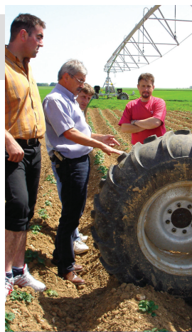
© CHAMBRE D'AGRICULTURE DE LEURE ET LOIRE